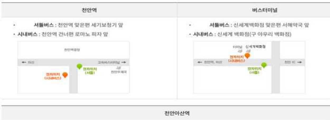
셔틀버스 및 시내버스 정차장소